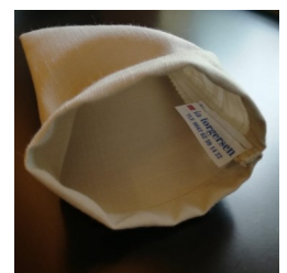
ETUI-45000 Lys grå