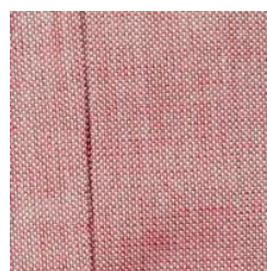
TM-55000-17 Rød Lyng